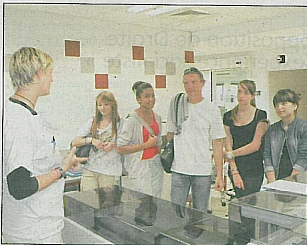
Les visite du laboratoire...

Les six filles et cinq garçons à avoir choisi l'option « découverte professionnelle » pour leur année de troisième au collège Ferrié, ont droit à des heures supplémentaires. Celles-ci sont mises à profit chaque jeudi après-midi pour des visites guidées à l'extérieur, dans le monde du travail. « L'objectif est de leur montrer un large panel d'activités pour bien les préparer à leur orientation et chaque semaine nous choisissons des sites différents qui peuvent aller de la pépinière à une en-