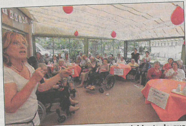
Hier au foyer Tonus Vitamine, les résidents de quatre maisons de retraite ont participé à un quiz.