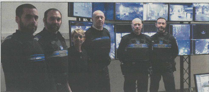
La police municipale elle aussi en alerte, avec notamment deux opérateurs pour surveiller la ville via le système de vidéo-protection.