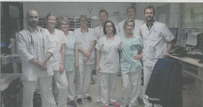
Au service des urgences de l'hôpital, comme ailleurs, il faut être prêt à tout instant à intervenir, pour éviter le drame et soulager les souffrances.